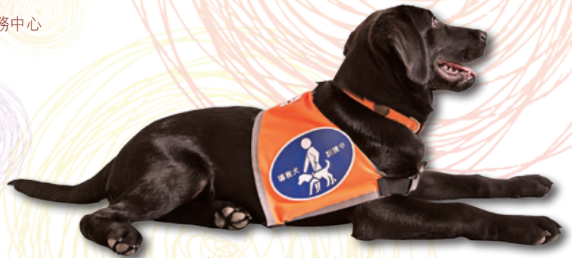
▲ 照片提供：香港導盲犬協會

導盲犬近年再次引入香港，在專業的志願機構支援下，現時全港的導盲犬、受訓中的導盲犬及導盲幼犬已超過 40 隻。導盲犬的主要功能是充當視障人士的「眼睛」，協助他們的日常生活。導盲犬在成長和訓練階段，會暫居於寄養家庭，而導盲犬訓練員和導師，均可以是健視人士。因此，攜帶導盲犬的人士除了視障人士，亦可能是寄養家庭的成員、導盲犬訓練員和導師。