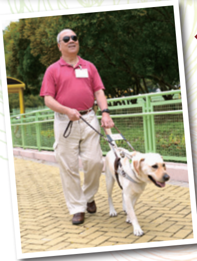
◀ 照片提供： 香港導盲犬服務中心