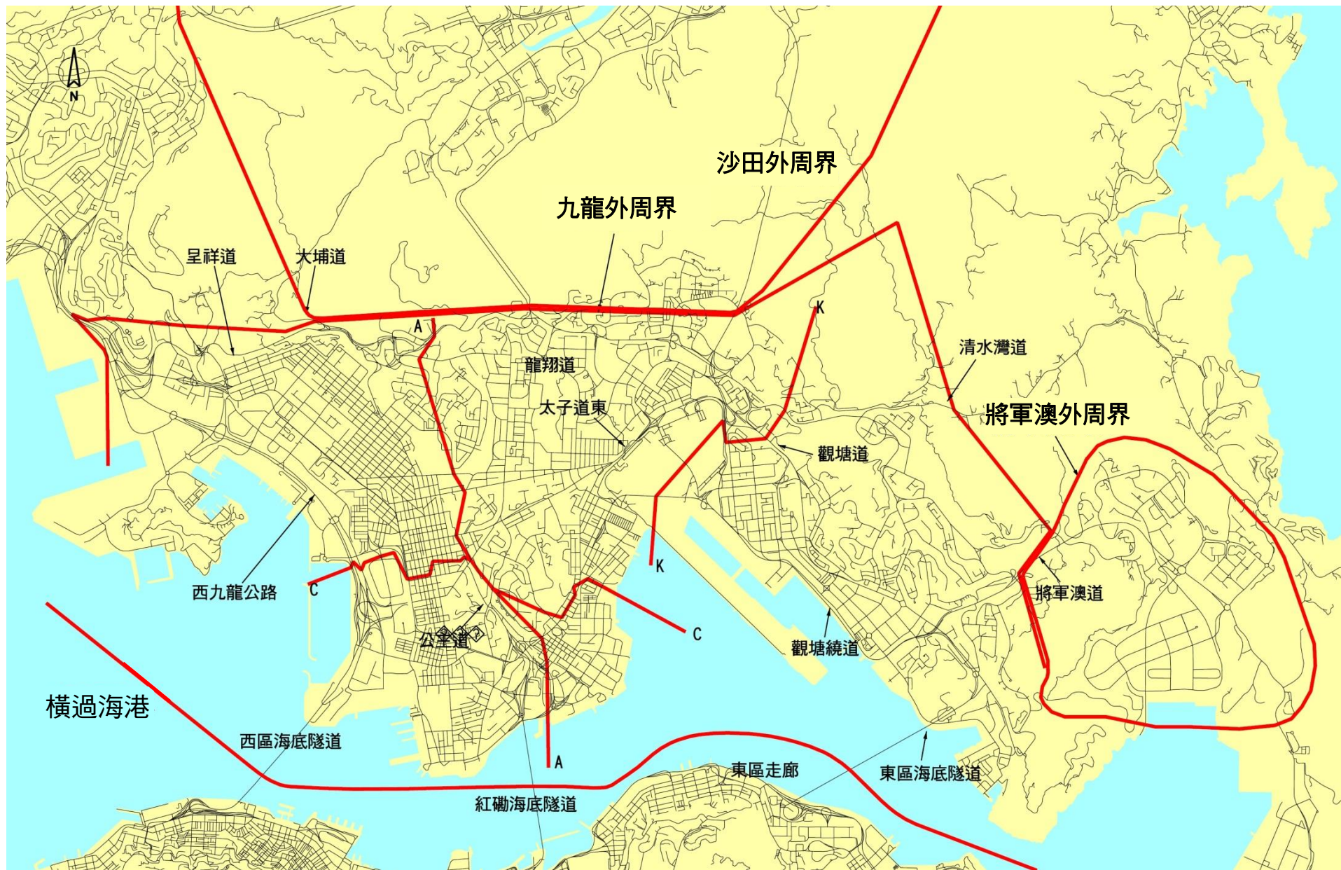
圖 A.3 : 查核線/周界分布圖 - 九龍