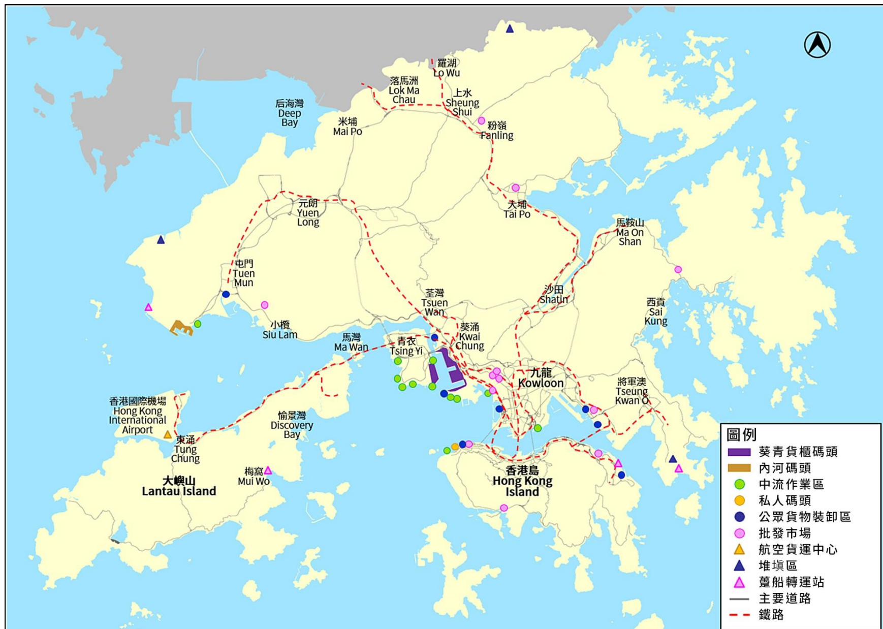
圖 A.1：特殊貨場分布圖

特殊貨場的行程特性調查主要針對那些產生頻繁而獨有貨車行程特性的不同種類用地（特殊貨場），搜集它們的貨車行程特性數據。