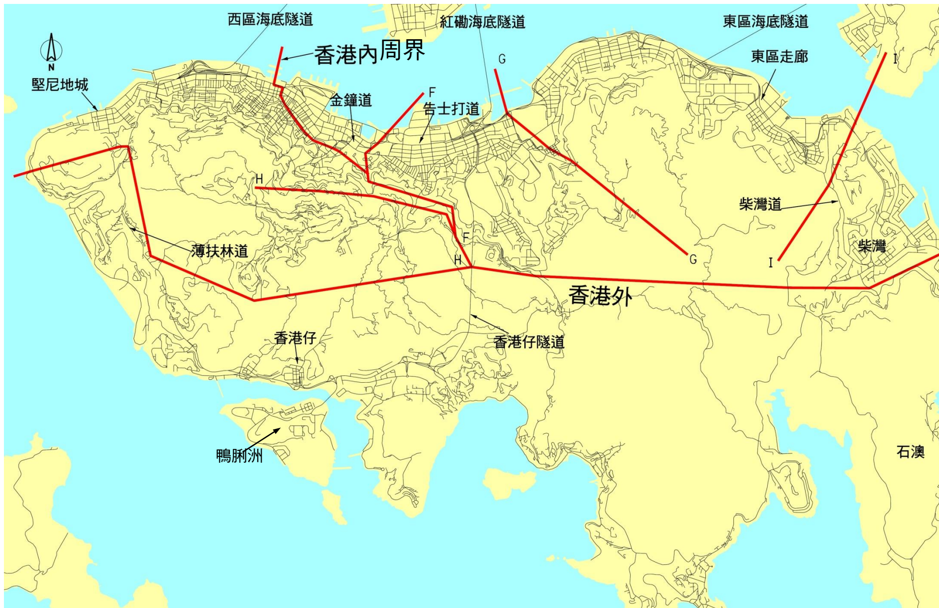
圖 A.2 : 查核線/周界分布圖 - 香港