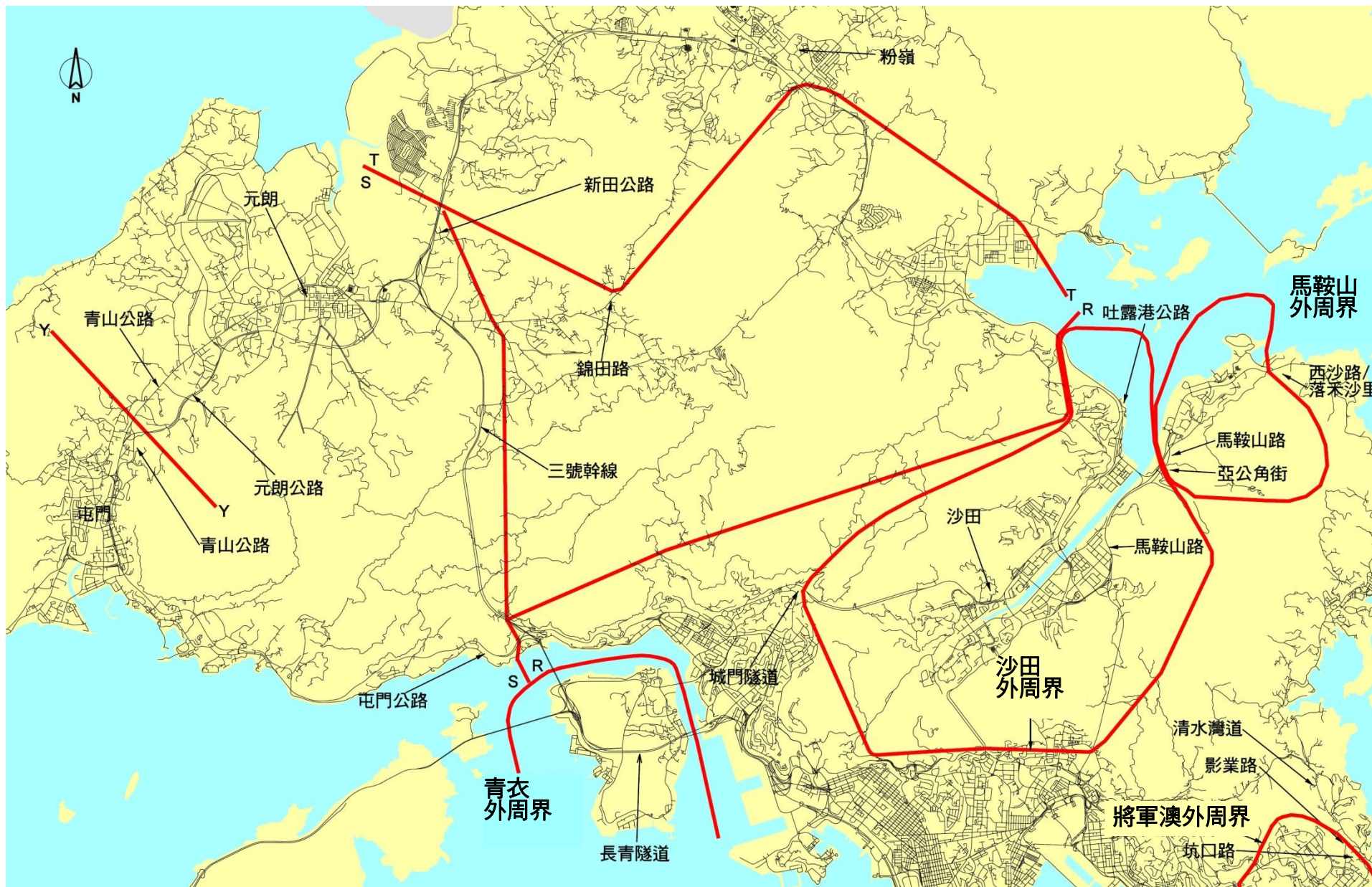
圖 A.4 : 查核線/周界分布圖 - 新界