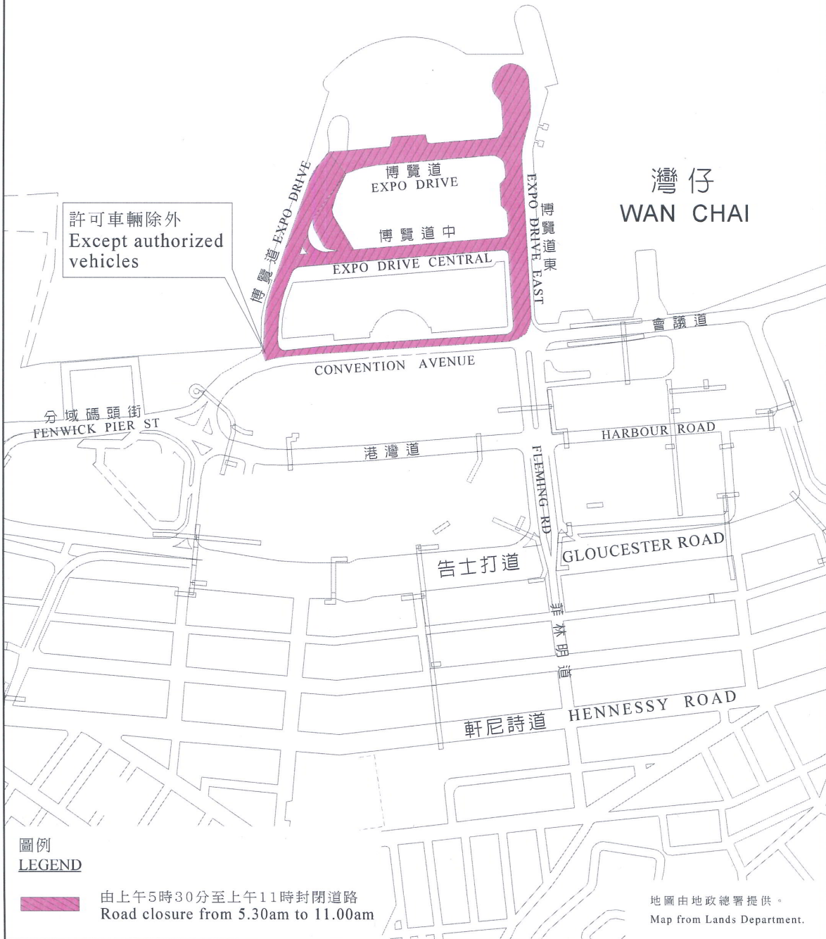
圖一 Figure 1

2012年10月1日升旗儀式及國慶酒會於灣仔北的特別交通安排 Special Traffic Arrangements in Wan Chai North for Flag Raising Ceremony and National Day Reception on 1 October 2012