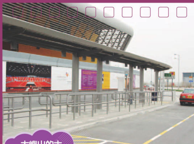
大嶼山的士上客區