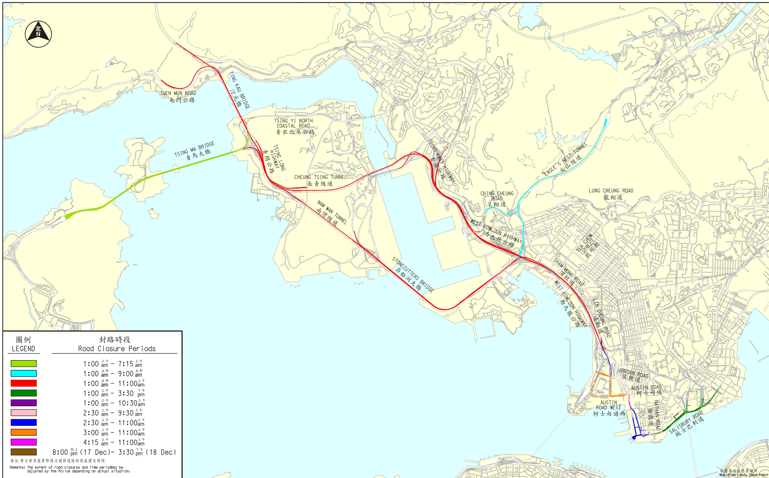
drawing title 圖一 Figure 1