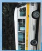
高級旅遊車司機課程