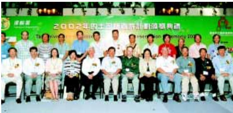
優質的士司機與嘉賓大合照

優 質的士服務督導委員會和運輸署於8月25日舉行的士司機嘉許計劃頒獎典禮2002，表揚18位優質的士司機。優質的士司機是由市民及遊客在過去一年內提名的良好服務或有優異品行的的士司機中選出並經過評審。各優質的士司機獲頒獎狀、獎座及石油氣加氣券以作鼓勵。運輸署亦會稍後額外印發優質的士司機證給予每一位優質的士司機。