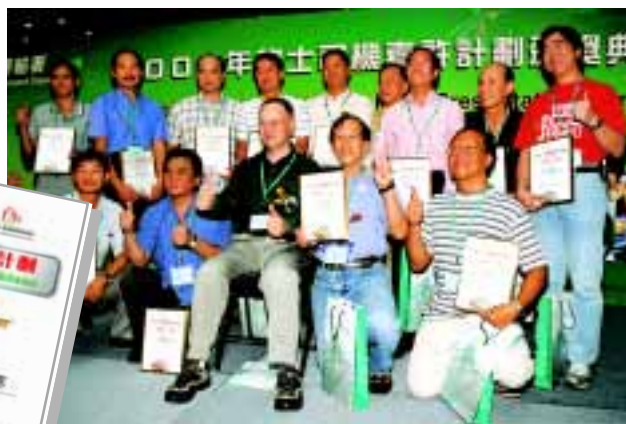
運輸署署長霍文與18位優質的士司機合照