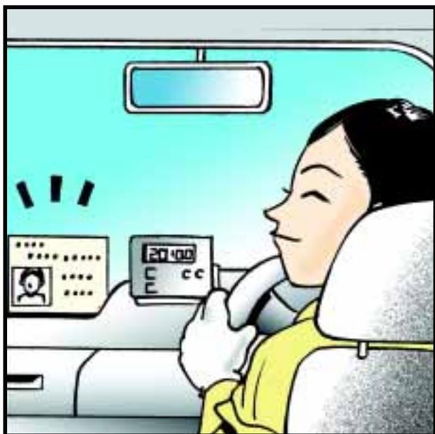
清楚展示的士司機證於的士咪錶左面的儀錶板上