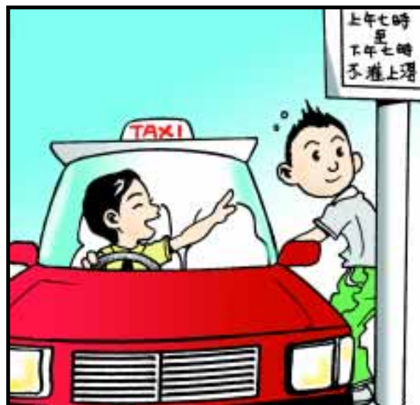
的士乘客不應在禁止停車地帶上落車