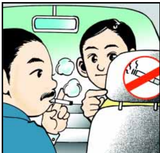
的士乘客不應在車廂內吸煙