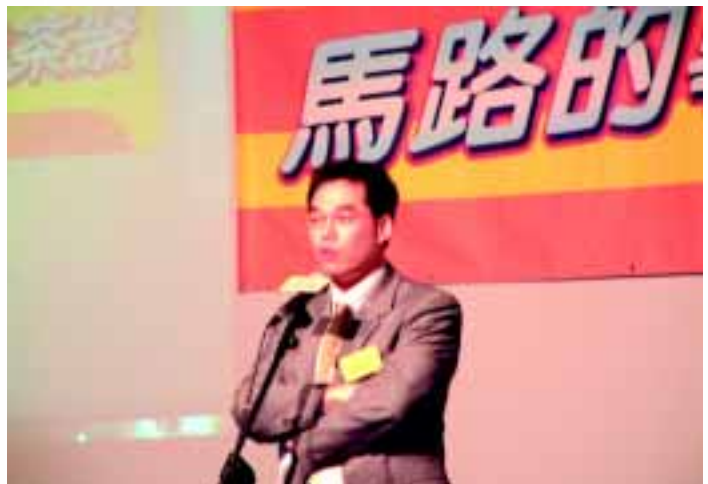
運輸署代表講解設置的士上落客點及更換的士司機證安排