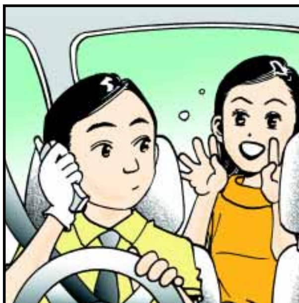
不可在車輛行駛時，使用手提式無線電通訊設施，包括無線電電話器