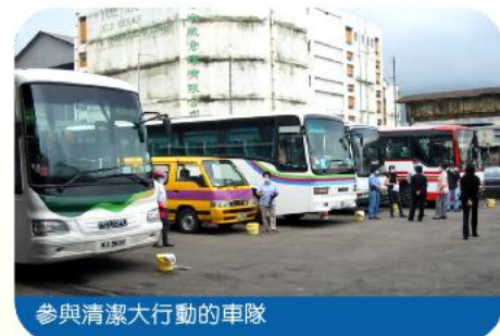
參與清潔大行動的車隊