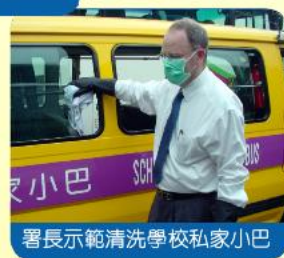
署長示範清洗學校私家小巴

運輸署署長當日除贈送口罩與業界代表外，他亦有指導旅遊車車長清潔車廂的正確步驟，並且戴上保護手套，親身示範清洗學校私家小巴的車廂，以行動表示對清潔運動的支持。