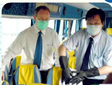
署長指導車長清潔車廂