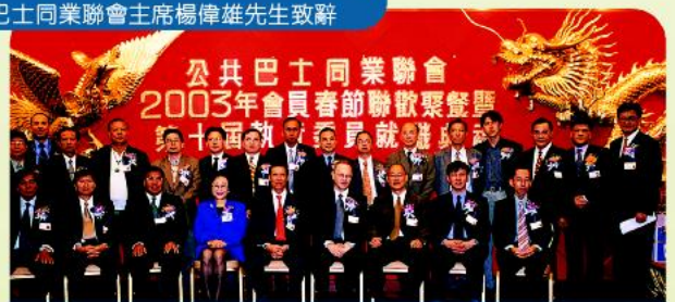
主禮嘉賓與新一屆執委合照