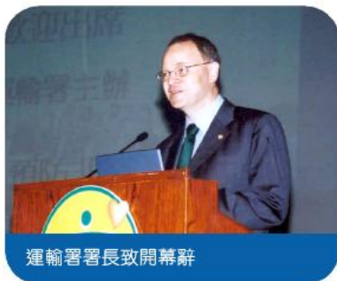
運輸署署長致開幕辭

繼四月一日的清潔行動，運輸署又於四月二日在大會堂舉行有關預防非典型肺炎健康講座，並邀請大約四十名輔助公共交通營辦商會代表（的士、小巴、非專營巴士及渡輪等）及逾三百名司機和前線工作者出席。