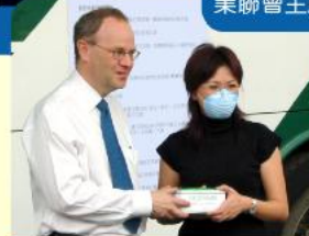
署長贈送口罩予學童私家小巴代表

本港自三月份證實首宗非典型肺炎的個案以來，市民為避免受病毒感染，都盡量減少外出。與此同時，各種公共交通工具的乘客人數均錄得不同程度的跌幅。非專營巴士及學校私家小巴業界所受的影響也不少，主要因為訪港旅客持續下降及中小學宣佈停課。這場疫症對業界的經濟衝擊，可算是前所未有。