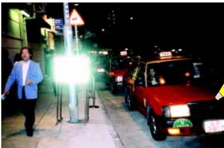
的士在跑馬地馬場門外有秩序地接載乘客