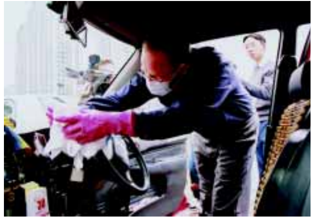
霍文署長並親身示範清潔的士