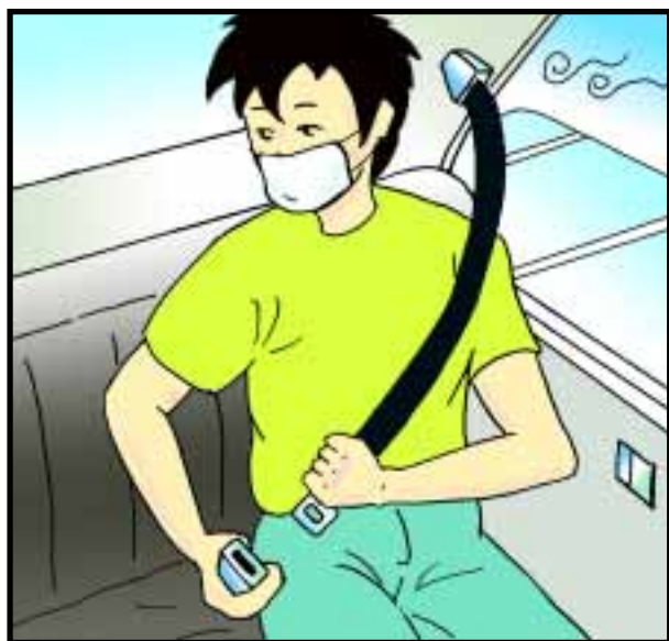
的士乘客應佩戴安全帶