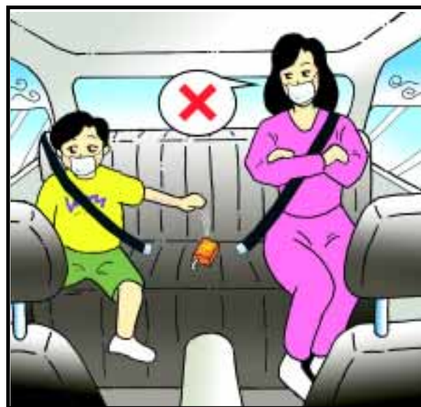
的士乘客不應在車廂內棄置垃圾