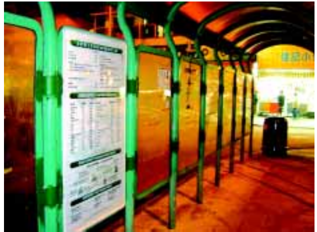
西貢福民路及將軍澳昭信路的士站已加設的士服務資訊牌，提供更多的士服務資訊