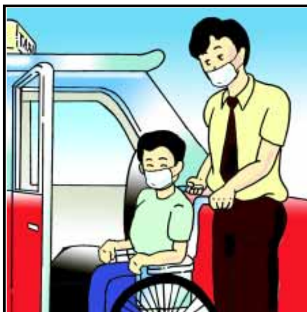
協助殘疾或年老乘客上落車