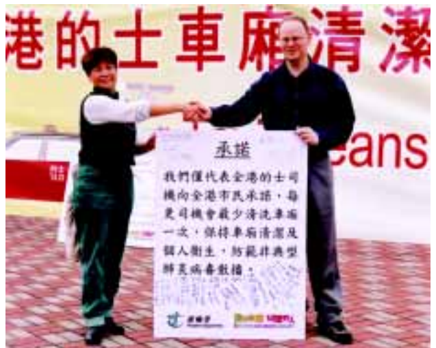
霍文署長與的士業代表承諾，聯手對抗非典型肺炎