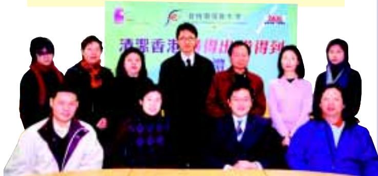
食物環境衛生署及商業電台代表與得獎者合照