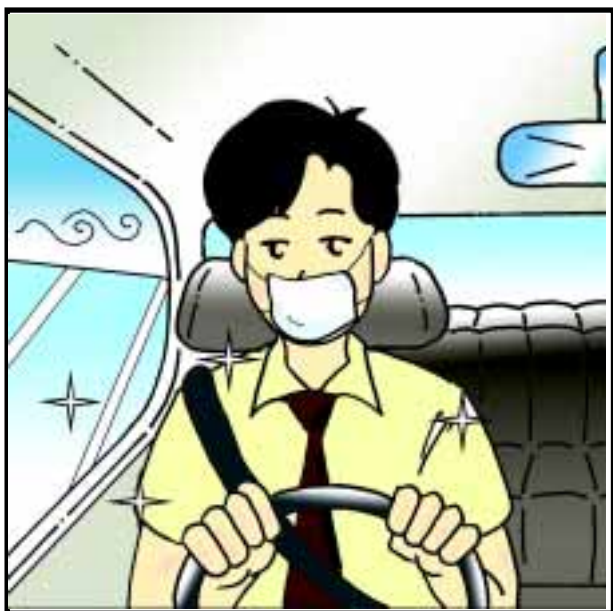
穿著清潔及恰當的衣服