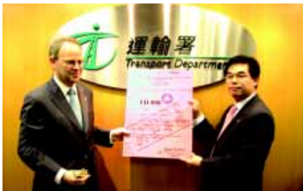
霍文署長與蘇祐安總運輸主任宣佈放寬的士一般停車限制安排

此外，運輸署亦由5月3日起，進一步放寬下午繁忙時段不准停車限制，由下午4時至7時縮短為下午5時至7時，以改善個別交通工具業界之營運環境。