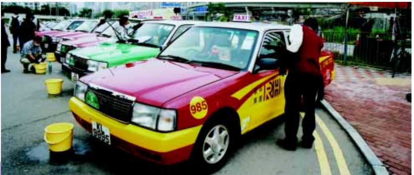
各的士司機落力清潔的士