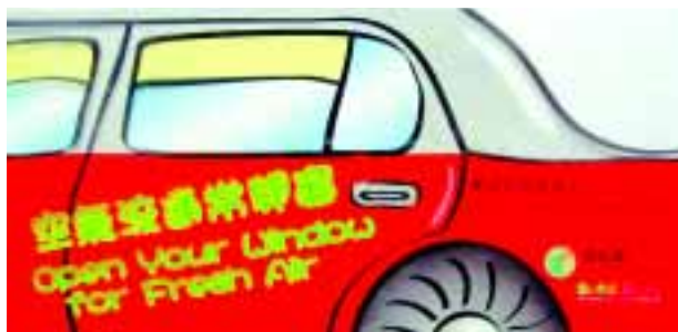
「空氣流通常開窗」膠貼

為加強呼籲公共交通工具司機及乘客，以及一般駕駛者，共同有效防範非典型肺炎的散播，運輸署特別印製四萬張「空氣流通常開窗．Open Your Window for Fresh Air」車窗膠貼，派發給的士司機及一般駕駛人士，提醒司機及乘客在行車時適量打開車窗，以確保空氣流通，減低非典型肺炎之散播。