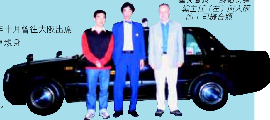
霍文署長，蘇祐安運輸主任(左)與大阪的士司機合照

運輸署署長霍文太平紳士年十月曾往大阪出席一研討會，期間霍文署長有機會親身體驗大阪的士服務。霍文署長對大阪之的士司機穿着整西裝，打煲呔留下深刻印象。他希望香港的士司機的專業形象能有朝一日可與大阪之的士司機看齊。