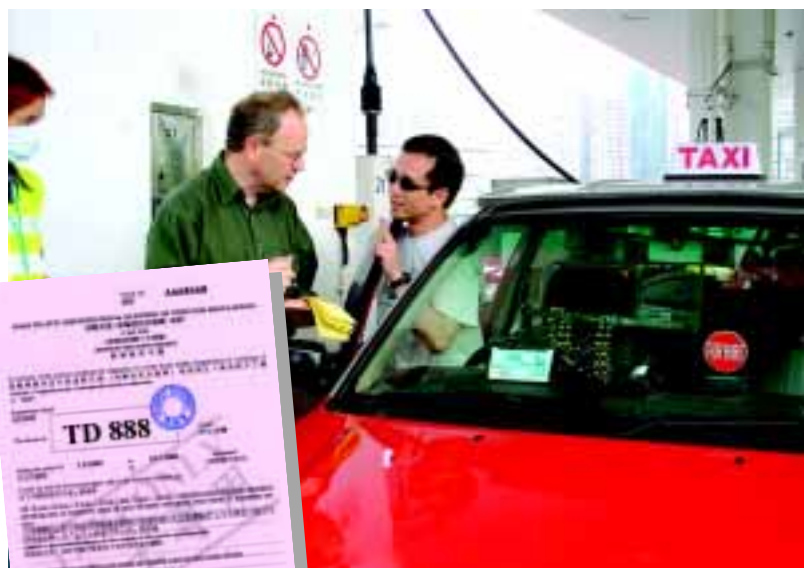
霍文署長親身到加氣站派發限制區許可證予的士司機

答:各的士司機必須遵守列明於許可證背面之條件中規則。同時,於限制區上落客時,不得阻礙其他道路使用者,必須遵守「即上、即落、即走」,以及不可停留等客之守則。