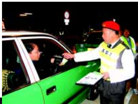
空的士須在新田公共交通交匯處的等候處取籌後才可駛入落馬洲管制站