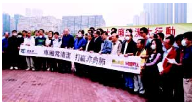
的士車廂清潔大行動

運輸署透過不同渠道聯絡的士業代表，了解行業於非典型肺炎肆虐下之營運情況，亦明瞭業界要求政府採取有效措施舒緩的士司機所承受的負擔及壓力。因此，運輸署於4月10日去信致各的士商會及工會，表明運輸署將儘快實施，改善的士營運環境。