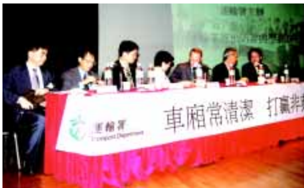
運輸署舉行健康講座

此外，運輸署亦於4月2日在中環大會堂舉行健康講座，邀請運輸署助理署長葉文光先生及香港醫學會容曉茵醫生教導各公共交通工具之前線工作人員，從車廂清潔及個人衛生兩方面，防範非典型肺炎的措施，並解答一般關於非典型肺炎之疑問。是次講座吸引超過二百名前線司機及工作人員參加。