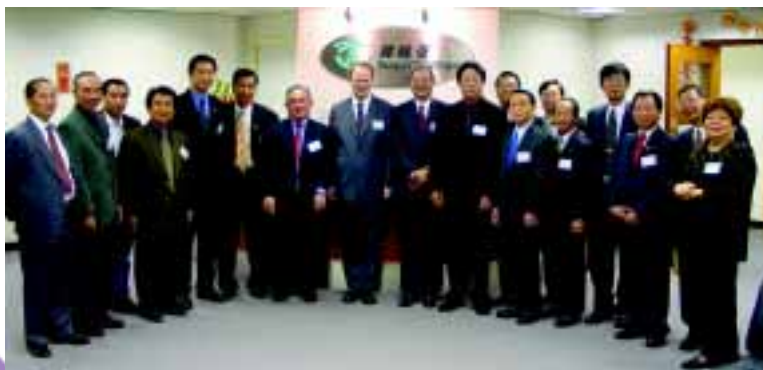
運輸署署長與的士業團體代表合照

農曆新年假期剛剛結束，運輸署署長於2月10日與的士業團體代表舉行新春團拜。署長感謝的士業團體一向支持本署與優質的士服務督導委員會推行之一系列優質的士服務計劃，如本年初推行的新的士司機證更換計劃、的士上落客點等。署長亦聽取的士業團體代表對行業經營情況的意見。署長希望各的士業界朋友在新一年生意興隆，身壯力健。