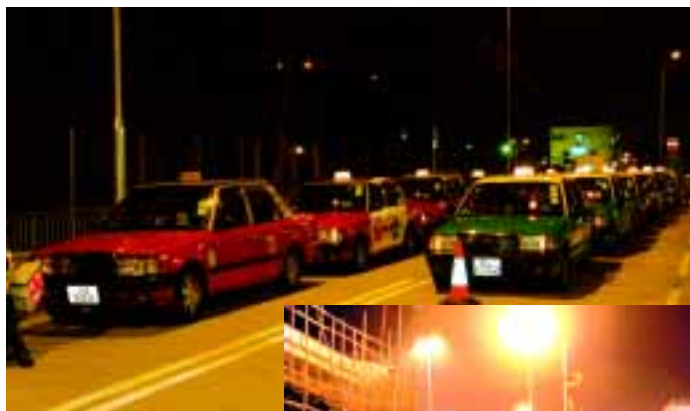
的士有秩序地進入管制站接載乘客