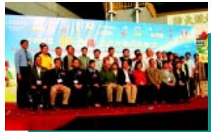
獲嘉許的士司機與嘉賓及委員合照

優質的士服務督導委員會聯同運輸署於2004年12月19日舉行2004年的士司機嘉許計劃頒獎典禮，表揚20位優秀的士司機。各優秀的士司機由市民和遊客提名，經過評審委員會作出評審。今年，20位優秀的士司機均獲頒優秀的士司機證、優秀的士司機證書、石油氣券、現金禮券、地圖及外套作獎賞。同時，四十五間的士聯會/電召台及由商業電台「馬路的事，不容錯失」24小時失物熱線所提名之800多位「車不拾遺」司機均獲頒嘉許狀及紀念品。