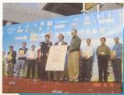
頒發感謝狀予車不拾遺的士司機代表