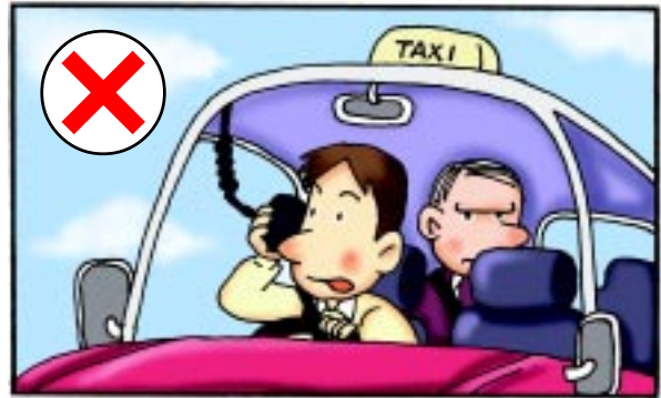
(i) 當駕駛時盡量少用無線電通訊器材