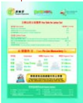
從寶蓮寺前往大嶼山各地的士價目表