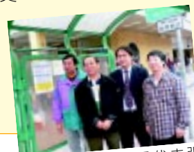
運輸署與的士業界代表張貼的士乘客資訊牌