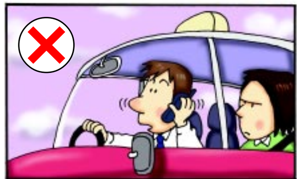
(ii) 切勿使用手提式無線電話