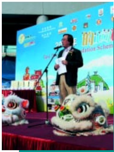
優質的士服務督導委員會主席曾寶強博士致辭