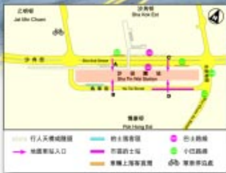
沙田圍站的士站示意圖