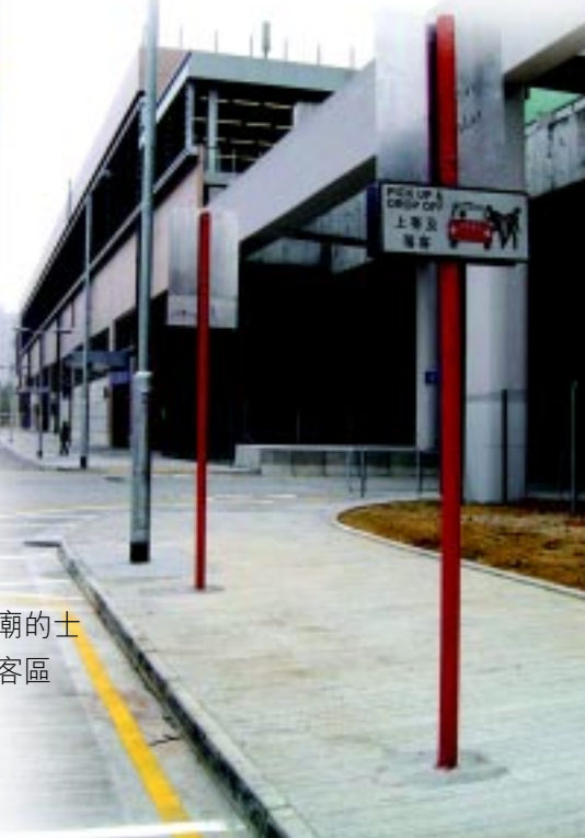
• 車公廟的士上落客區