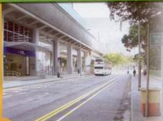
東鐵馬鞍山支線之的士配套設施安排