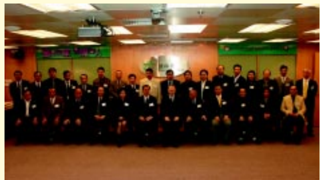
運輸署署長與運輸業界代表合照