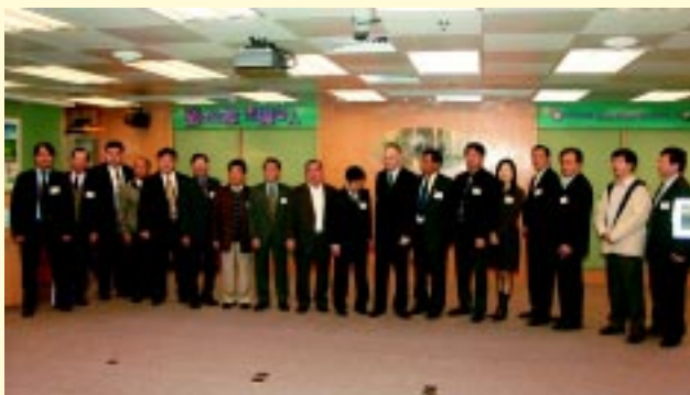
運輸署署長與的士團體合照

當日，有超過三十個運輸業團體(包括六個的士團體)將南亞賑災籌得善款五百萬元捐贈香港特區政府。霍文署長非常感謝各的士團體及其他運輸業團體之善心，並對整個行業之團結感到驕傲，並鼓勵各團體繼續保持這份合作精神。