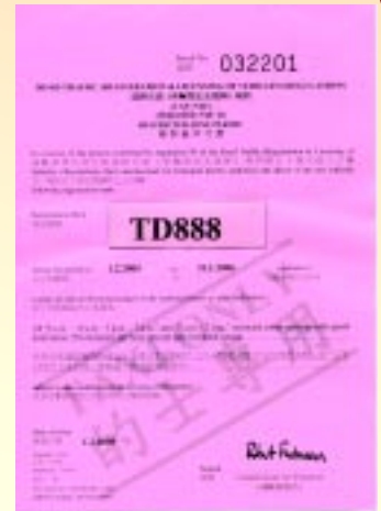
放寬的士停車限制措施延長至2006年1月底。

各的士車主／司機如需申領新許可證，可帶備其現有許可證前往運輸署四個牌照事務處辦理有關手續。