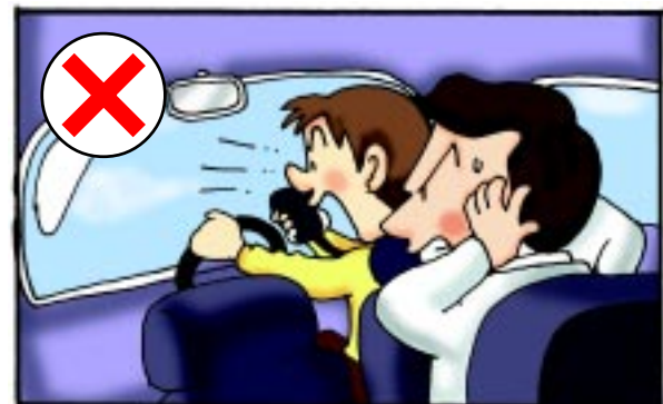
(iii) 談話時聲量不要太大