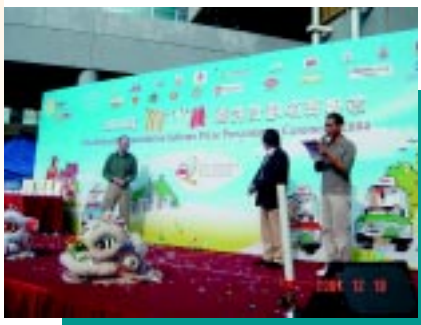
開展優質的士服務督導委員會的標誌