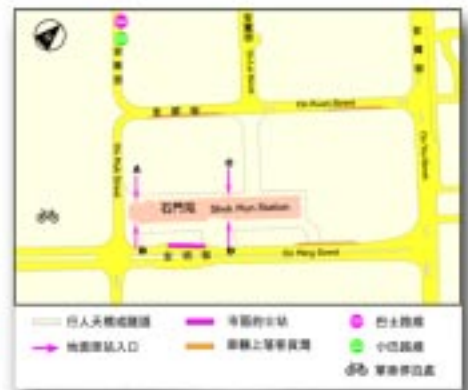
石門站的士站示意圖