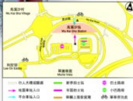
烏溪沙站的士站示意圖