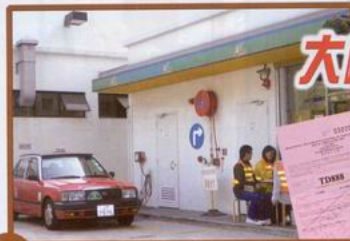
延長放寬的士停車限制措施