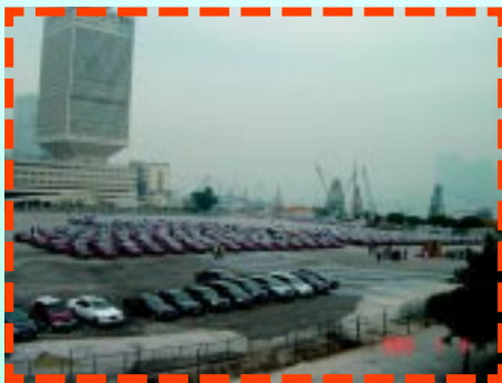
支持南亞賑災善款車隊

的士車行車主協會及香港的士小巴商總會於南亞災禍後發起了「呼籲全港的士南亞賑災大行動」，在短短的數天內共籌得善款港幣一百萬元正，並捐贈予香港特區政府。在運輸署之協助下，於2005年1月4日在添馬艦舉行了一個善款捐贈儀式，並邀請了運輸署署長霍文太平紳士接收善款。另外有超過五百輛的士及的士車主/司機到場支持呼籲行動，希望能向市民及的士乘客作出呼籲。