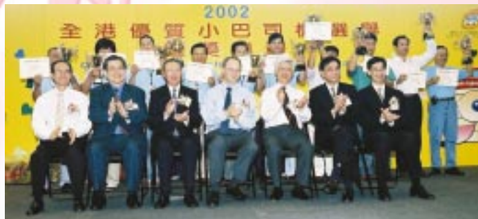
全港優質小巴司機選舉 2002「傑出小巴司機」獲獎名單