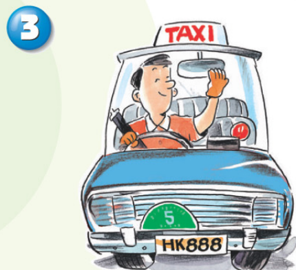
保持專業的駕駛態度