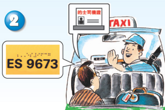
展示的士司機證及點字和摸讀字車輛號碼牌