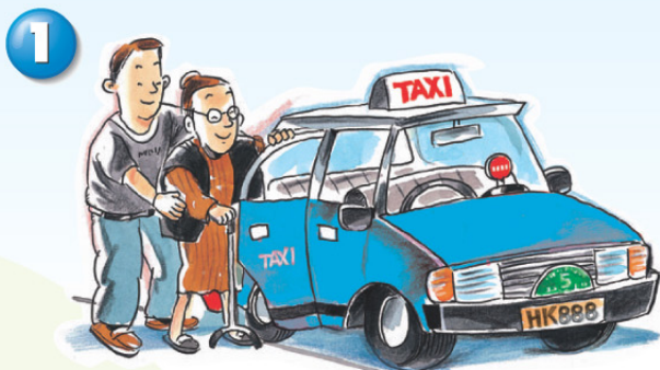
協助有需要的乘客