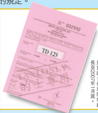
放寬的士停車限制延長至2007年1月底。

還未申領新限制區許可證之的士司機，可於辦公時間內前往本署四個牌照事務處（如下表）辦理換證手續。最後，本署請各的士司機自律，善用措施給予的彈性，及嚴格遵守「即上、即落、即走」及「不可停車等候」的規定。