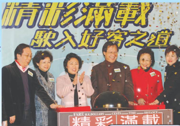
的士好客運動啟動禮