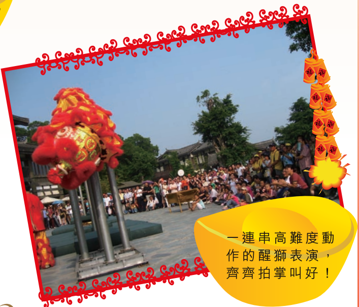
一連串高難度動作的醒獅表演，齊齊拍掌叫好！

是日壓軸的聯歡晚宴，三百多位團友一起享用美食之餘，並舉行幸運大抽獎，當晚大獎由其中一席10位團友共奪得伍仟元的車用石油氣禮券，他們均曾替「馬路的事不容有失24小時免費的士失物熱線1872920」的乘客尋回失物之好心的士司機及其親友，絕對是「好心有好報」！「商業電台 馬路的事 輕鬆暢聚遊2007」亦在一片掌聲之中圓滿結束。