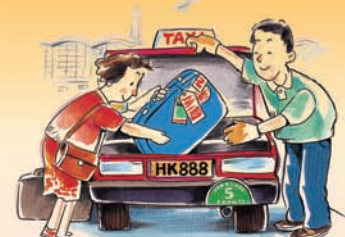
盡量協助乘客搬運行李上落車廂