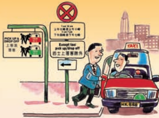
在顧及其他道路使用者的情況下上落乘客