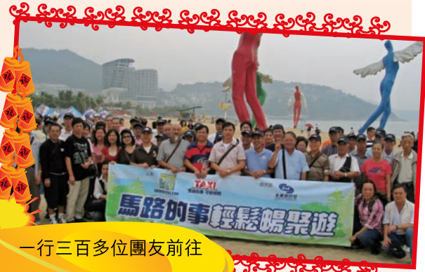
一行三百多位團友前往 深圳大梅沙旅遊區「鬆 一鬆，抖一抖」！

當日來自各大的士商會及各界職業司機商會之主席與會員，以及「馬路的事 不容有失」之的士司機，帶同家人好友，一行三百多人在周日清晨浩蕩出發，前往深圳大梅沙旅遊區。