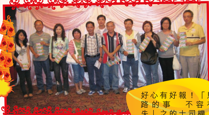
好心有好報！「馬路的事 不容有失」之的士司機，奪得當晚大獎。

當日活動還可以遠離都市繁囂，遊覽以「回歸自然」為宗旨的主題公園-深圳東部華僑城，團友欣賞到在茶田實景中演出的少數民族歌舞，還有醒獅表演，精彩絕倫。之後參觀橫跨多個山頭的茶田、濕地花園及各種環保設施，認識保護環境的知識，全身走進綠色大自然。