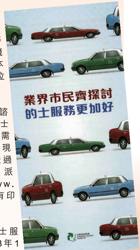
業界及公眾諮詢文件

歡迎的士業及市民就文件第9頁至第10頁有關香港的士服務收費模式、服務模式和質素等方面發表意見，並於2008年1月31日前以下列方式交回：