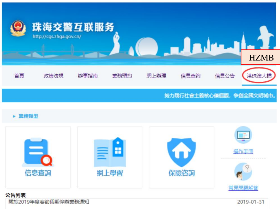
圖 1 Figure 1

Browse the website at http://bridge.zhjj.org.cn:9080/ to enter into HZMB screen (see picture 1).