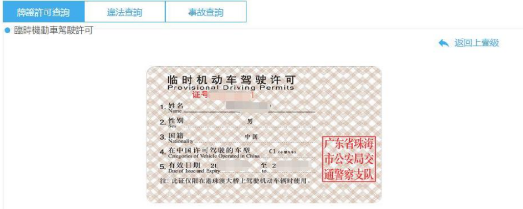
圖 7 Picture 7