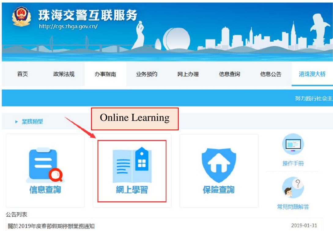
圖 19 Picture 19

Press “ Online Learning ” to enter into the leaning modules for cross-boundary driving (see picture 19).