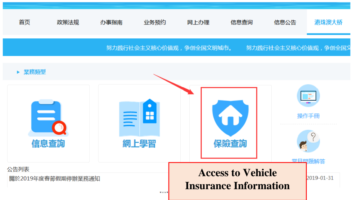
圖 21 Picture 21

Press “ Access to Vehicle Insurance Information ” (see picture 21).