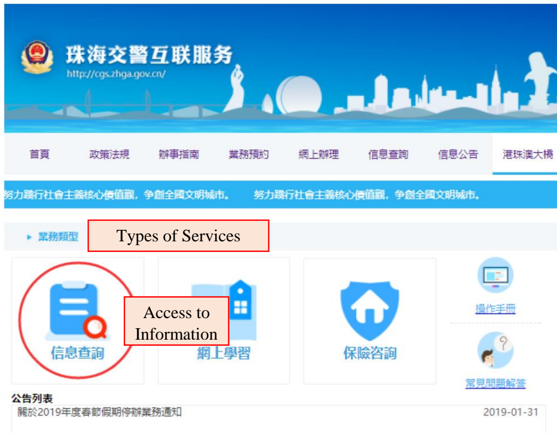
圖 2 Figure 2

Click on " Access to Information " under "Types of Services" and go to "Access to Vehicle Information" screen (see picture 2). Applicants may check the status of approval of Filing Records and upload the Mainland vehicle insurance.