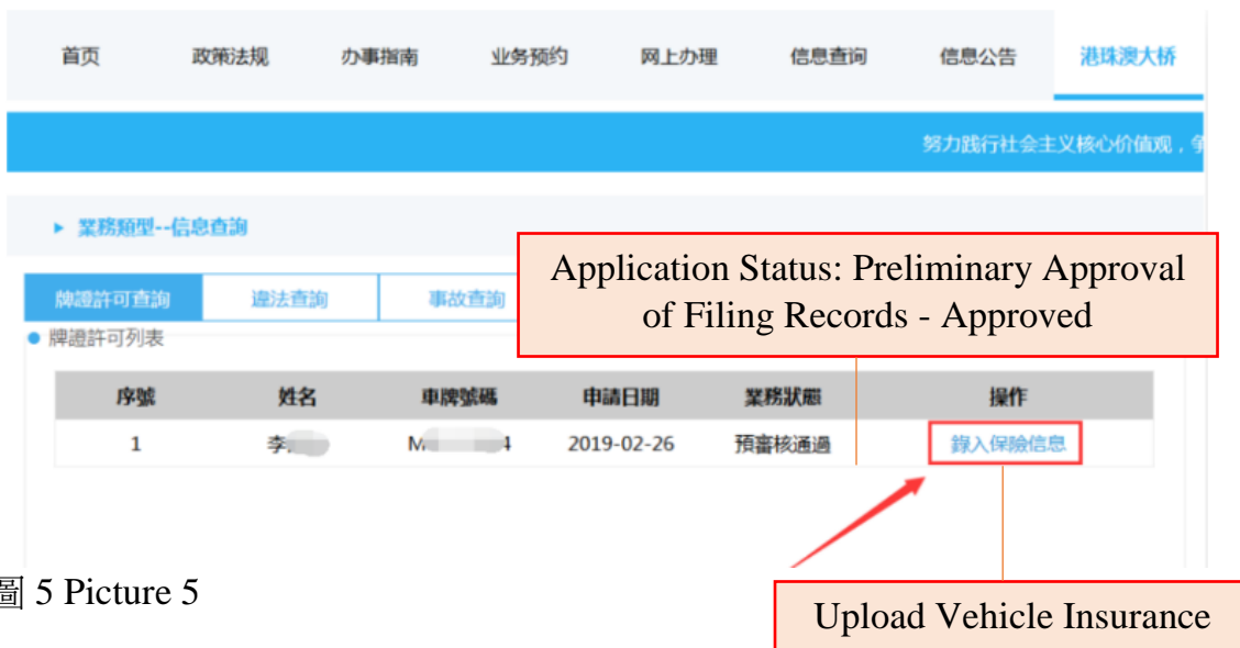
圖 5 Picture 5

Click “ Upload Vehicle Insurance ” to upload Mainland compulsory traffic accident liability insurance for motor vehicles (see picture 5). For details, applicants may read “2.2 Entering Vehicle Insurance Information” in this manual.