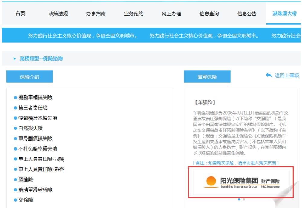
圖 25 Picture 25