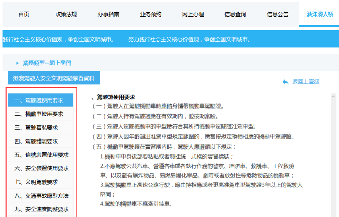
圖 20 Picture 20

Click on hyperlinks to study regulations and requirements for drivers in Mainland (see pictures 20).