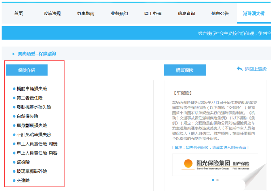
圖 22 Picture 22

Click on hyperlinks on the left to study the various types of insurance (see pictures 22 & 23).