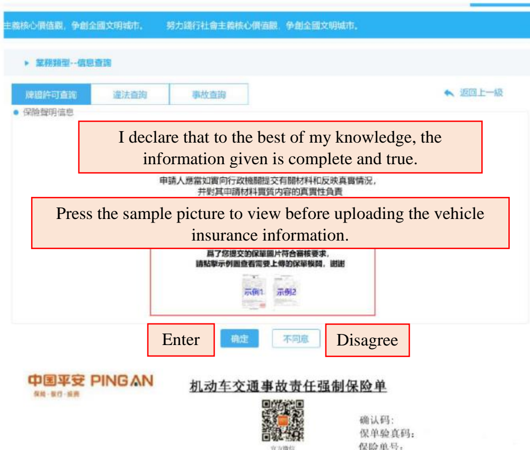
圖 15 Picture 15