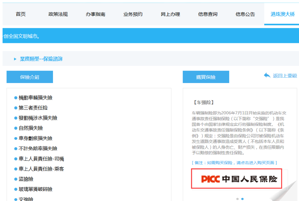
圖 24 Picture 24

Applicants could take out vehicle insurance by clicking on " Sunshine Insurance Group " and " People's Insurance Company of China " on the right (see pictures 24 & 25).