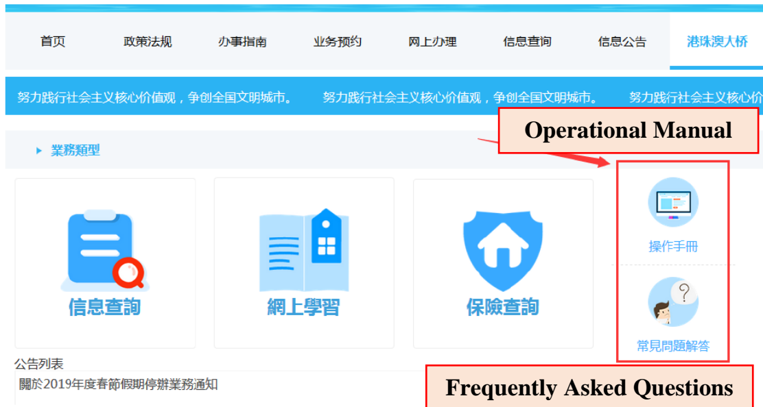
圖 26 Picture 26

Applicants are advised to download the operational manual of Mainland's online filing platform for formal approval of Filing Records by clicking on " Operational Manual ". For enquiries on uploading the Mainland vehicle insurance information and checking status of approval of Filing Records, press " Frequently Asked Questions " (see picture 26).