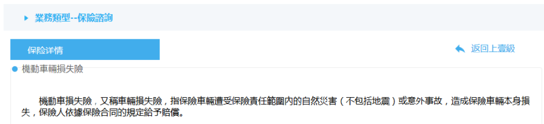
圖 23 Picture 23