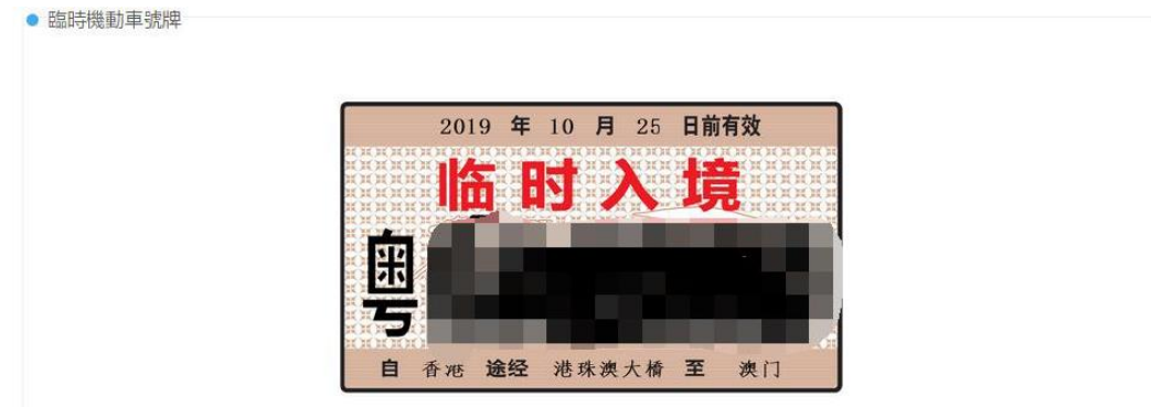
圖 8 Picture 8