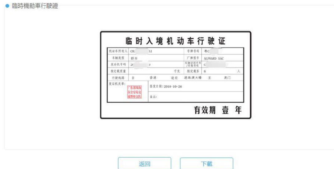
圖 9 Picture 9